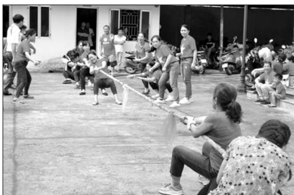
Thi đấu kéo co đồng đội nữ

1. Ngày 10/6/2018, tại trụ sở Báo Lạng Sơn, Hội Nhà báo tỉnh Lạng Sơn đã tổ chức Giải thể thao lần thứ VI năm 2018 nhân dịp kỷ niệm 93 năm ngày Báo chí cách mạng Việt Nam (21/6/1925 - 21/6/2018). Tham dự có trên 70 vận động viên là cán bộ, hội viên hội nhà báo, phóng viên, biên tập viên, viên chức và người lao động thuộc các cơ quan báo chí trong tỉnh gồm: Báo Lạng Sơn, Đài Phát thanh và Truyền