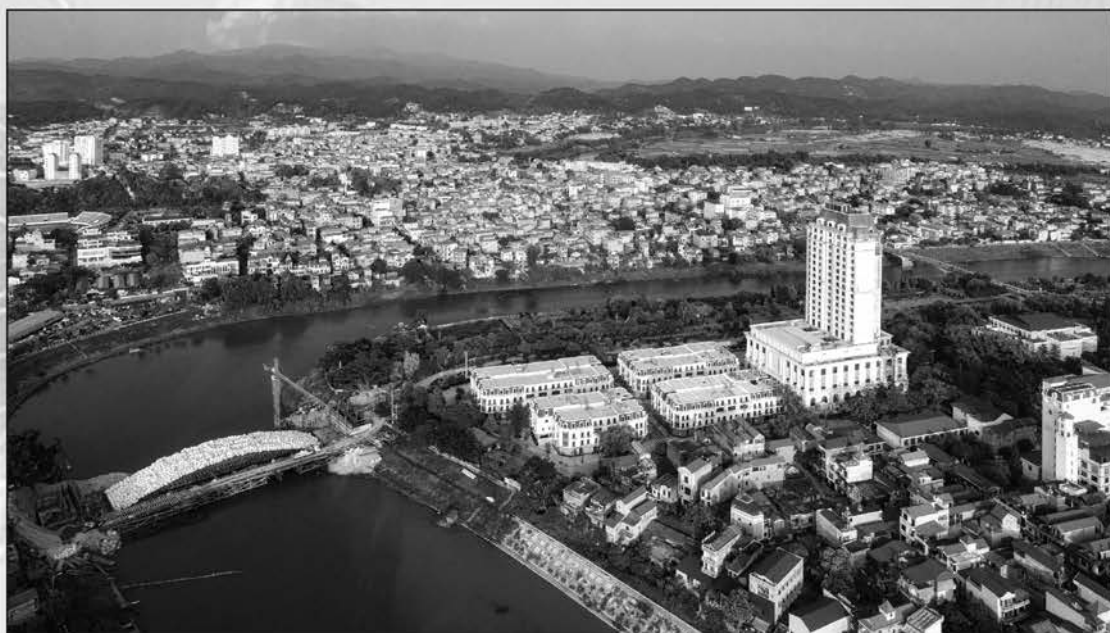
Nét đẹp công trình mới