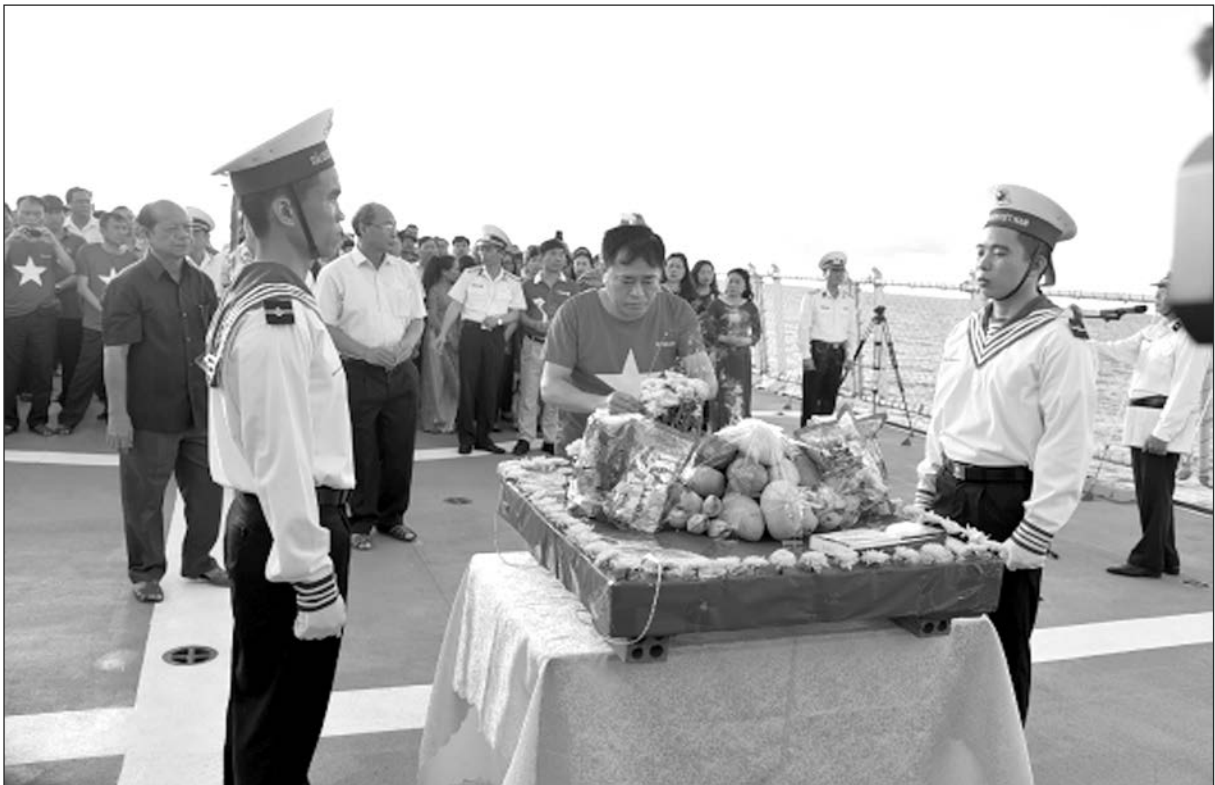
Lễ tưởng niệm các anh hùng liệt sĩ hy sinh trên quần đảo Trường Sa của Đoàn công tác số 12 (tháng 5/2018)