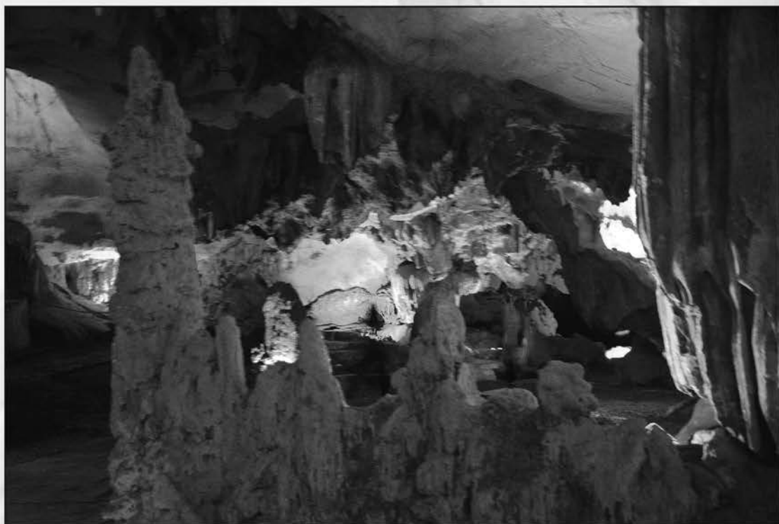
Vẻ đẹp động Nhị Thanh