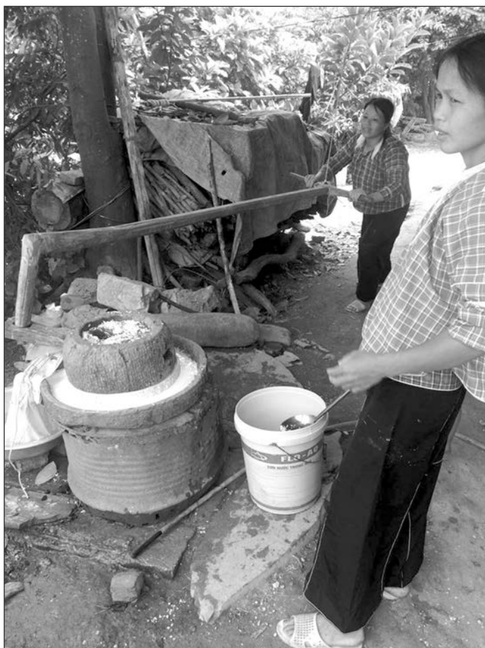
Xay bột làm bánh