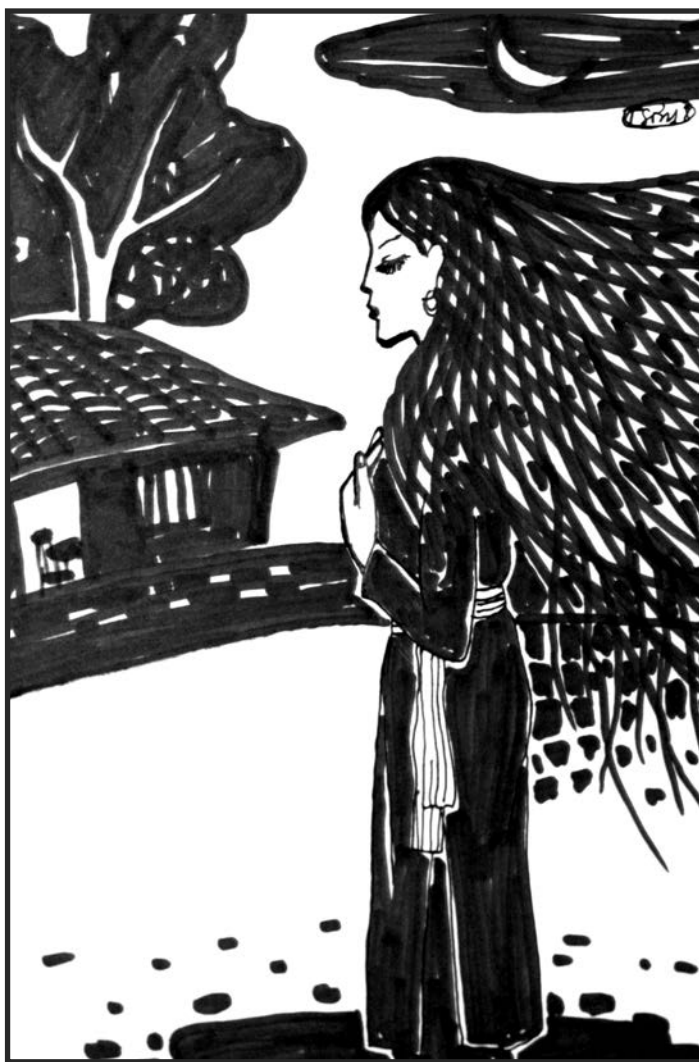
Minh họa: CAO THANH SƠN

Niềm vui của ông giáo đang dâng tràn thì bỗng nhiên bị hụt hẫng, ông