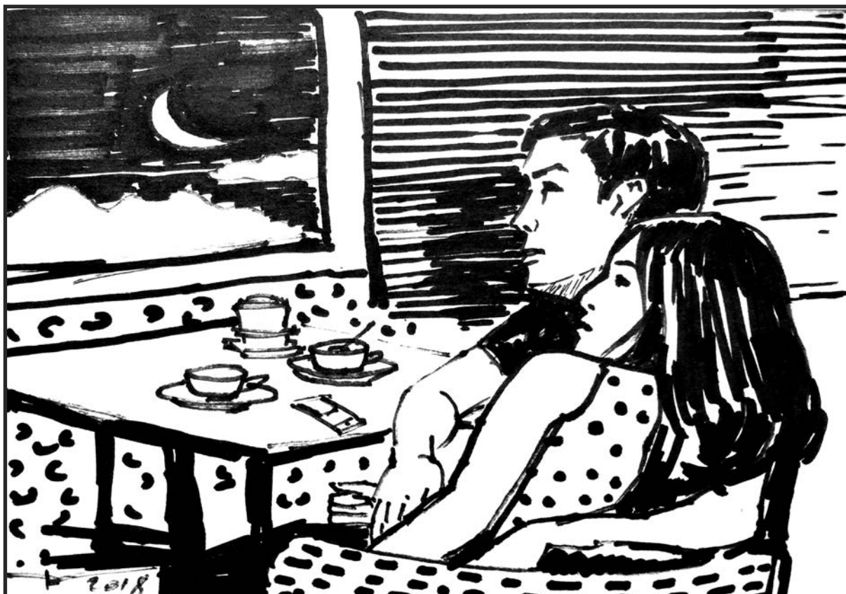
Minh họa: HOÀNG ĐIỂM