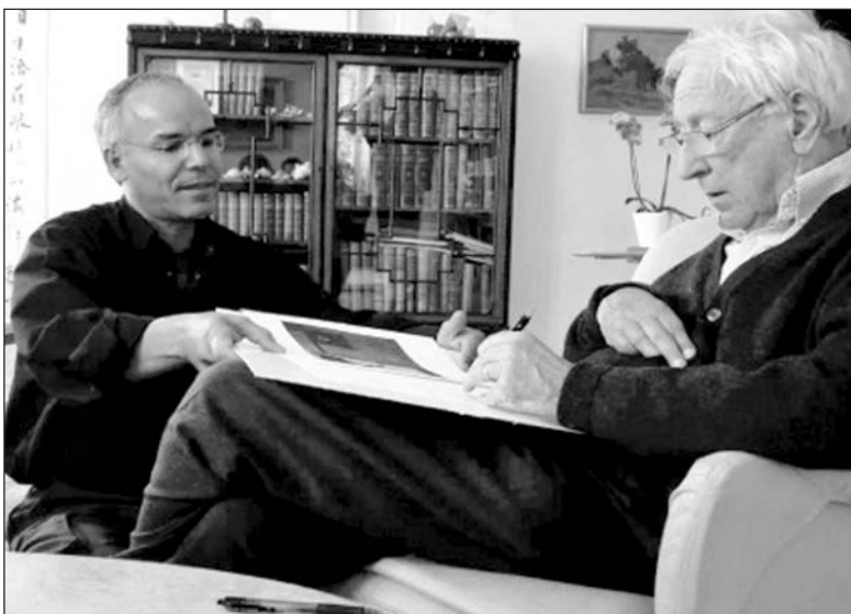
Viết bằng tay trái

Trên thực tế, Tomas Tranströmer cũng không thuộc một trào lưu, xu hướng sáng tác nào. Giai đoạn đầu, ông có chịu ảnh hưởng của trường phái siêu thực Pháp, có gần với chủ nghĩa biểu hiện Đức. Dần dần, ông bớt dùng những hình ảnh mang tính định đề, hướng tới những hình tượng tự nhiên,