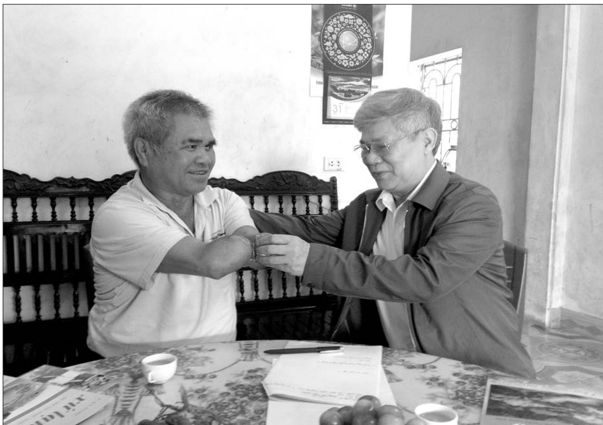
Chạm chén cùng khách quý

Người cựu binh ấy dùng hai cùi chỏ để giữ lấy chén rượu, nâng lên, chạm cùng khách quý rồi nói cười rôm rả, như thể việc vắng đi cả hai bàn tay không bận gì lớn lắm đến ông. Nhưng, để sống, để quen với việc cơ thể của mình không lành lặn, thật quá là điều chẳng dễ dàng gì. Ngoài sự nỗ lực của bản thân, sự động viên, giúp đỡ của đồng đội, thì sự tận tụy hy sinh của người vợ trẻ mà nay đã lên bà, trong suốt những năm tháng cuộc đời dài dằng dặc, đã trở thành nguồn sống, giúp người thương binh ấy trụ lại, và vui sống yêu đời.