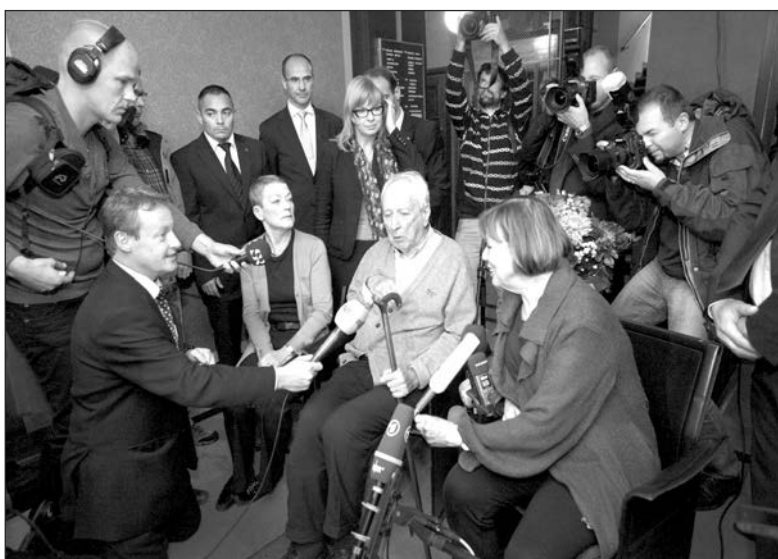
Giữa các đồng nghiệp

Tiếp xúc thường xuyên với bi kịch cuộc sống, nên thơ ông điềm đạm và nhân văn. Và, chừng như, để giải tỏa cho chính mình, ông lại luyện được thêm một nghề nữa - nghệ sĩ biểu diễn piano chuyên nghiệp. Hoạt động đa chiều và dày đặc của ông tưởng như bị chặn đứng bởi một cơn tai biến mạch máu não đầu thập niên 1990 khiến ông bị liệt nửa người bên phải. Mặc dù vậy,