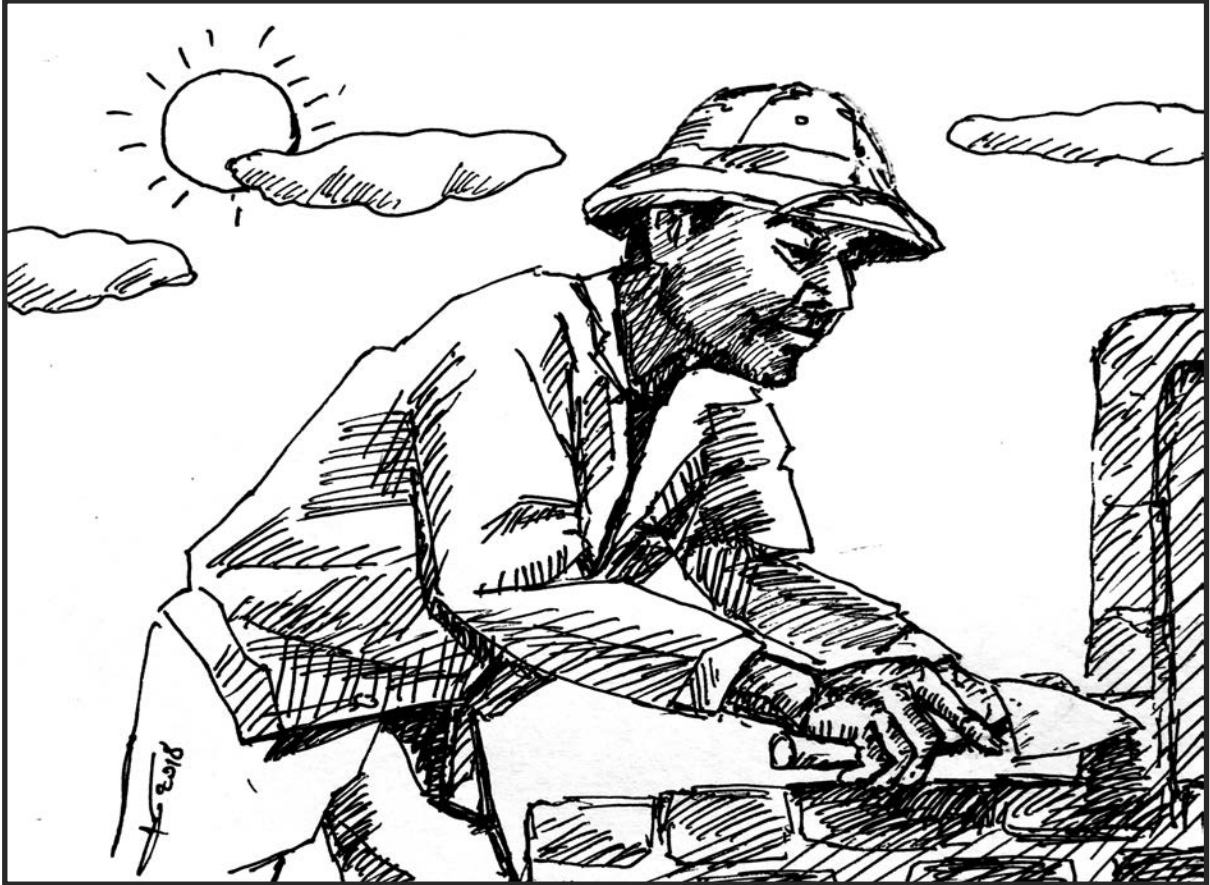
Minh họa: TÂN MINH

Lâu lắm rồi tôi mới gặp anh, nhìn thấy tôi anh vội chạy ra vui vẻ chào, giơ tay bắt tay tôi. Cái bắt tay chắc nịch của người lính bộ binh năm xưa. Sau cái bắt tay, chúng tôi ôm nhau thân thiết. Anh nắm vai tôi lắc mạnh: