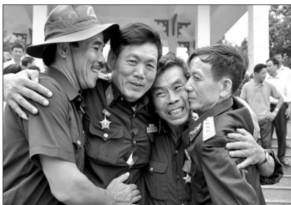
Tình đồng đội

Ngày chiến thắng anh không trở về Con sóng nhỏ vỗ bờ đê thương nhớ, Bóng chiều hôm tia nắng cuối nhạt nhòa Đồng đội ơi? Đồng đội! Nén hương lòng vẫn cháy đỏ trong tim Còn nhớ không ngày chúng mình giữ chốt? Điều thuốc chia ba, chiến hào ngang dọc Chia lửa bên nhau, súng thép đỏ nòng Đồng đội ơi, thương nhớ lắm! Lệ sương rơi trắng đất anh nằm. Ngày chiến thắng tới thăm đồng đội San sẻ niềm vui kể những chuyện đời... Dù chia ly hai cõi trời cách biệt Vẫn thương nhau trong vòng tay tri kỷ Nhớ một thời không thể nào quên.