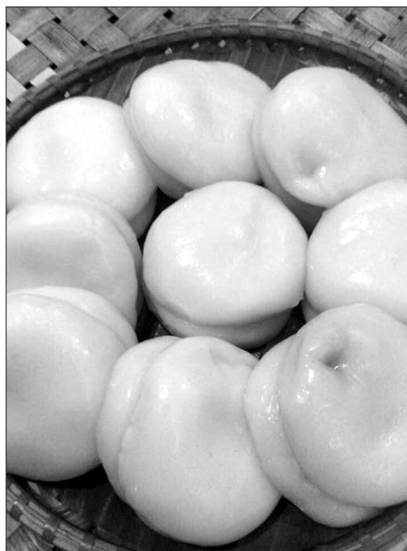
Bánh dậm - món bánh thường được làm trong dịp tết so lọc