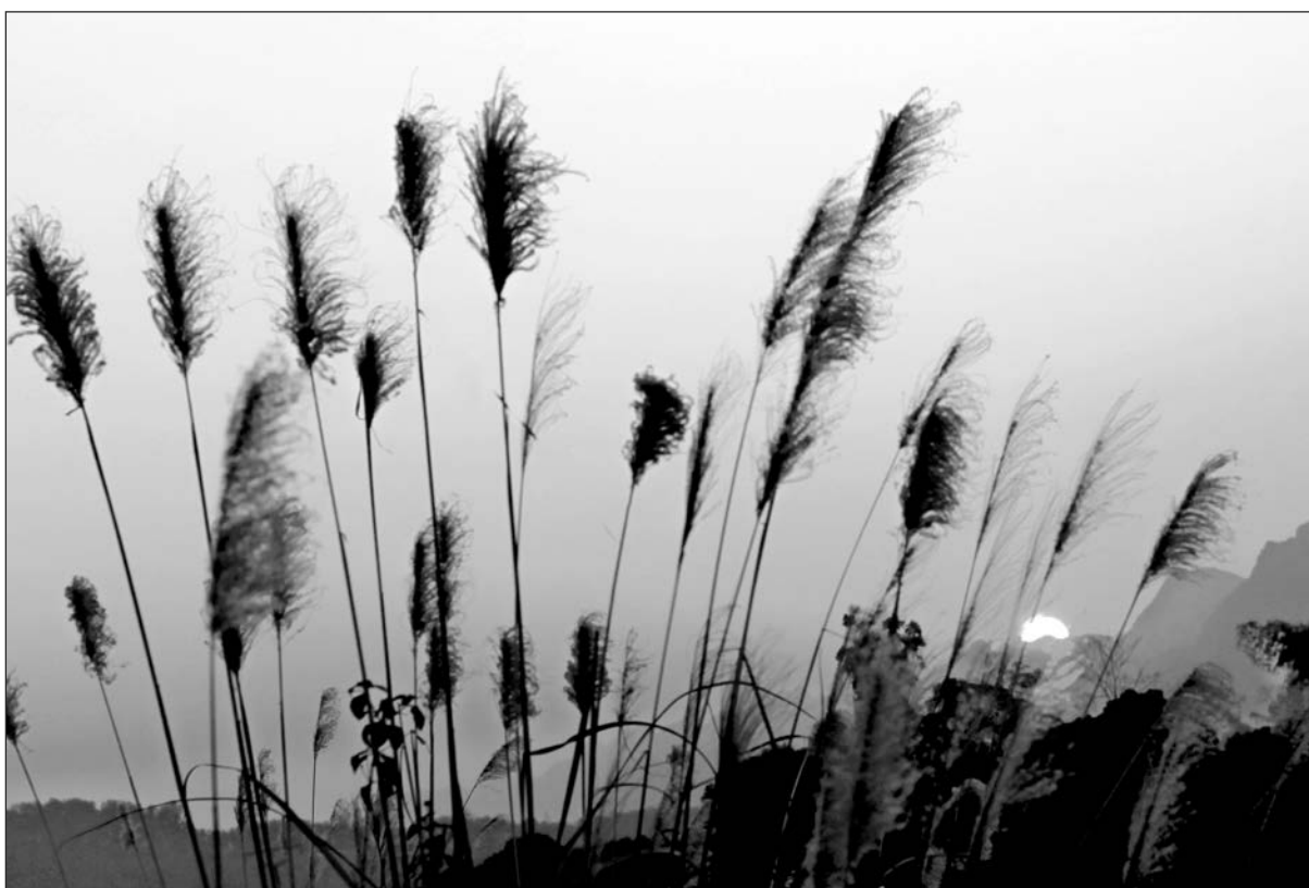
Mùa cỏ lau